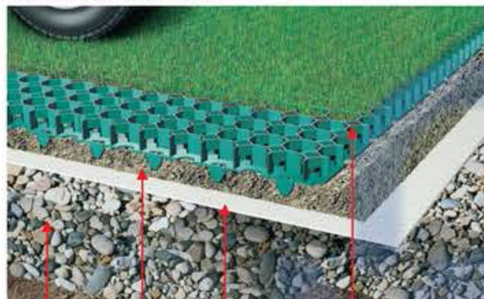
zhuťný štěr písek zemina geotextilie GUTTATEX

Zatravňovací tvárnice GUTTAGARDEN se pokládají velmi jednoduše. Optimální je nosná vrstva, která se skládá z dostatečné vrstvy štěrku.